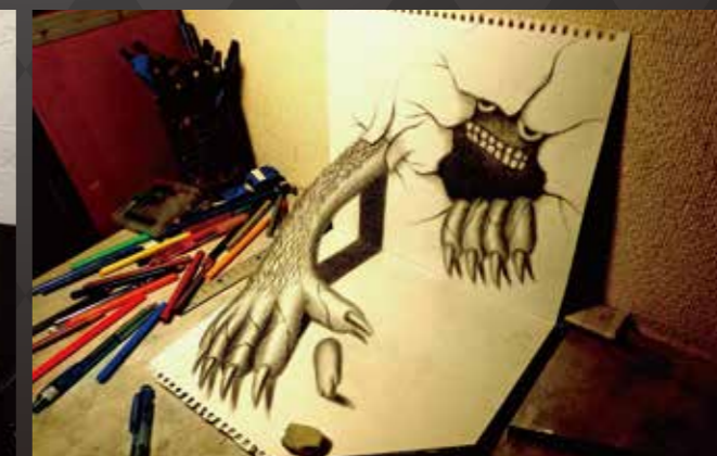
永井秀幸《姿を現した怪物》