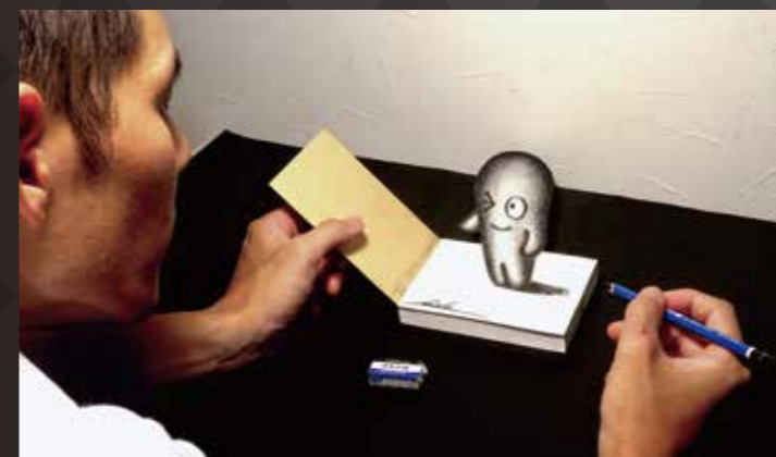
永井秀幸《メモ帳から飛び出すプミィー》