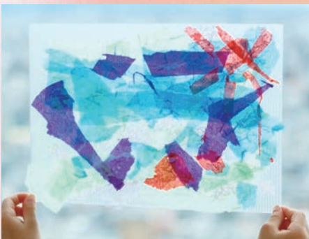
光でうかぶ形・色