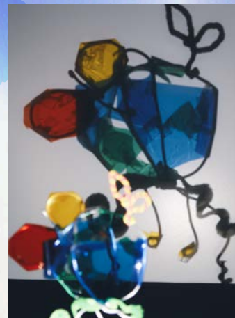
くねくねシルエット

館内には、他に「そら まち 色いろ」「アート・カードでゲームをしよう」「Sampling!!! こどもたちの作品」等のコーナーもあり、予約不要で体験できます。